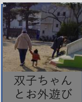
双子ちゃん とお外遊び