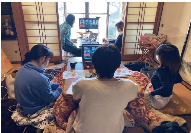
会場参加の方の様子