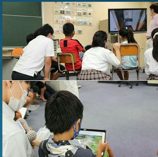
芦屋市立宮川小学校 キッズスクエアにて 小学生にタブレットでの 使い方を教える高校生