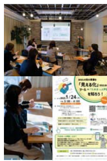
芦屋NPOセンター 社協市職員説明会