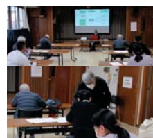
甘日市市阿品合コミュニティ説明会