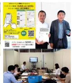
東京都町会連合会会長 説明会 中野区 職員説明会