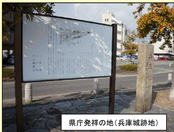
県庁発祥の地(兵庫城跡地)

とき 平成29年3月29日(水)13:30～16:30 (受付・開場12:30～)