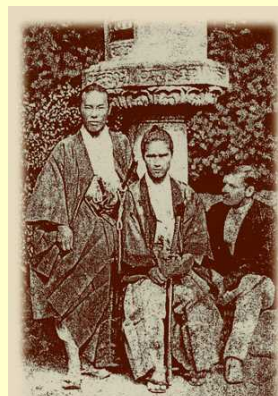
初代兵庫県知事 伊藤博文(左) 初代衆議院議長 中島信行(中央)