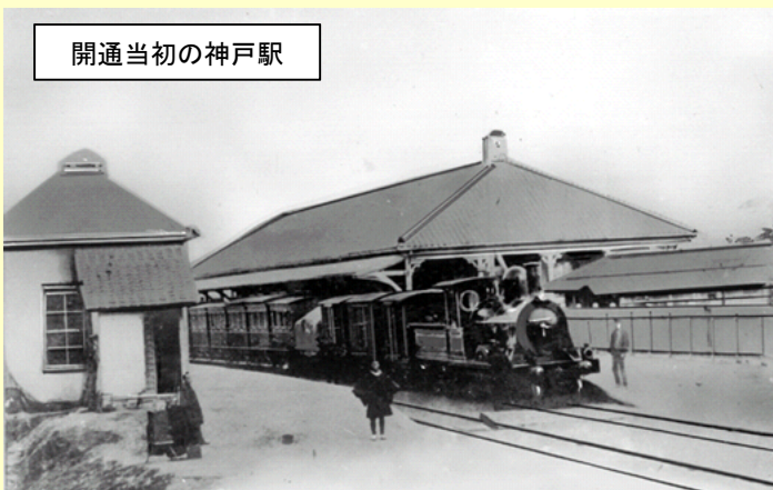
開通当初の神戸駅