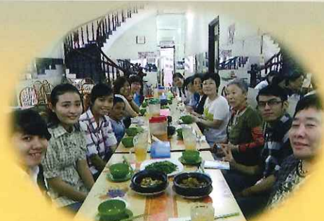
大学生に奨学金贈呈。和やかな交流

これまでの生活に プラス1(ONE) あなたのために あなたが作る 学びと体験の旅 子ども達の笑顔を 現地の仲間とともに 体験を通じて学び合う さりげなく自然な ボランティア体験 心の通い合う交流の旅です