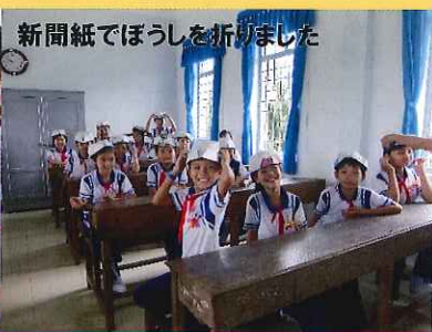
新聞紙でぼうしを折りました