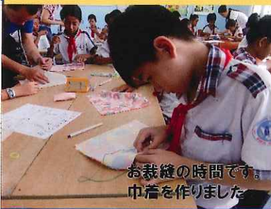
お裁縫の時間です。 中着を作りました

ダナンとホーチミンで、「プラス未来ファンド」ベトナム奨学金の贈呈を行います。 経済困難で優秀なベトナムの学生に教育支援する奨学金です。私たちの応援が若者の 未来の可能性の扉を開きます。共に生きる仲間に皆様の応援をお願いします。