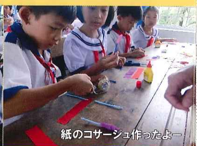
紙のコサージュ作ったよー