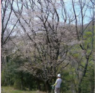
満開のヤマザクラ