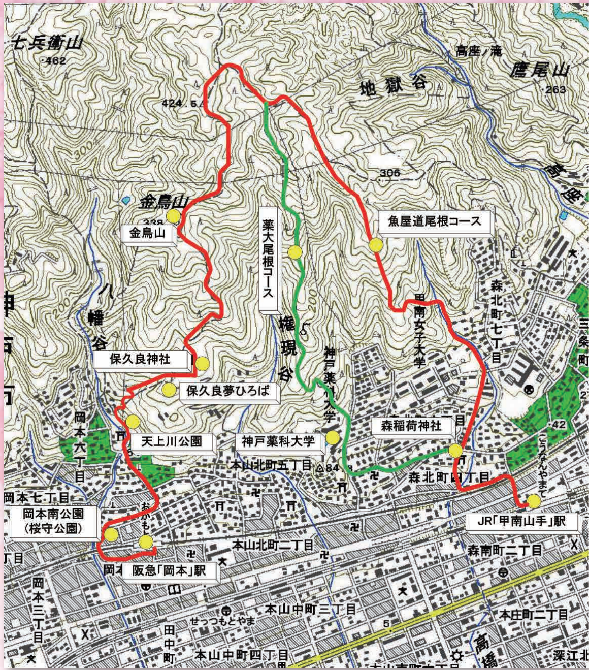
「この地図は、国土地理院長の承認を得て、同院発行の数値地図 25000 (地図画像) を複製したものである。(承認番号 平 30 情複、第 986 号)」「承認を得て作成した複製品を第三者がさらに複製する場合には、国土地理院の長の承認を得なければならない。」