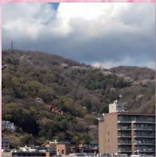
岡本から望む保久良神社付近の桜回廊