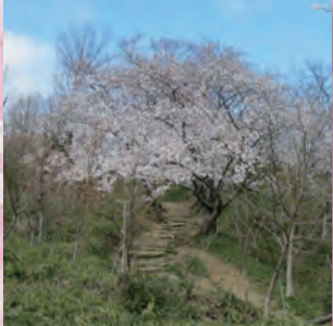
金鳥山に向う登山道沿いのサクラ