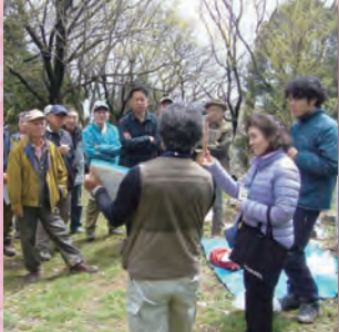
判り易くて楽しい自然観察会