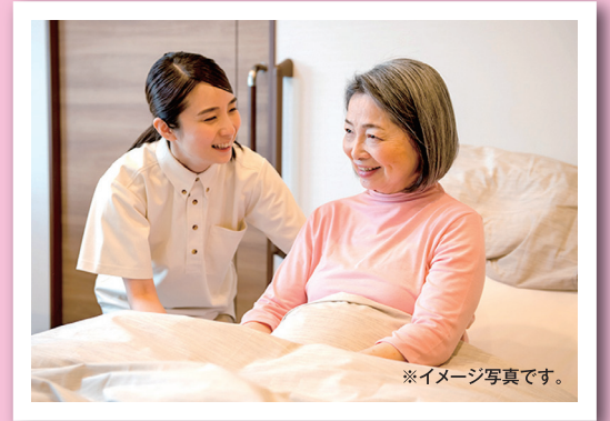
※イメージ写真です。