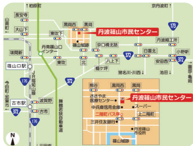
丹波篠山市民センター