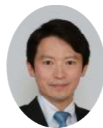
特別顧問 齋藤元彦 兵庫県知事