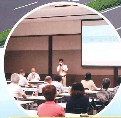
ボランティアスタッフ養成講座