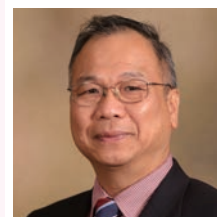
Wing Thye Woo

(カリフォルニア大学デービス校経済学名誉教授／ 「国連持続可能な開発ソリューションネットワーク」アジア担当副代表)