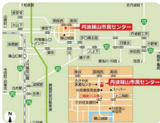
丹波篠山市民センター