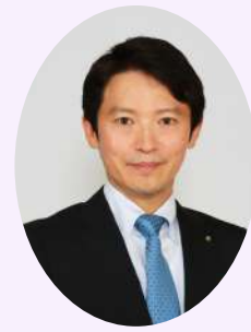
特別顧問 齋藤 元彦 兵庫県知事