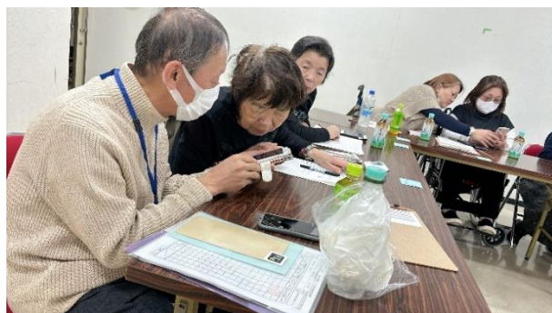
スマホ入門講座でのサポートの様子（尼崎）