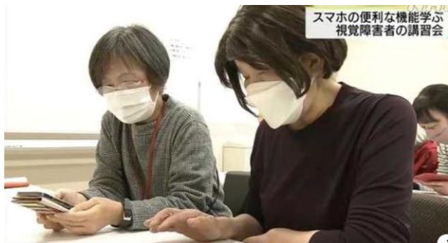
スマホ講習会でサポートの様子（加古川）

「たくさん来るメールのメッセージを削除や移動をできるようになって、メールの整理が楽しみです」「カレンダーアプリに音声で入力して、スケジュールを確認することで、安心して外出できます」「視覚支援アプリで郵便の差出人や文書を自分で読めるようになり、便利になりました」との感想をスマホユーザーさんからいただいています。このように、スマホは視覚障がい者にとって必須の生活ツールと言えます。